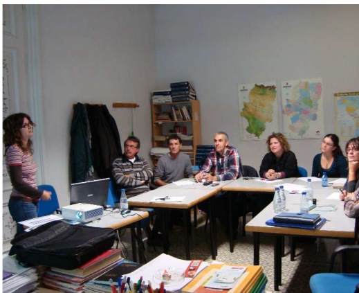
Plan de Juventud